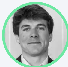
JB. Bonhoure Ateliers Perrault